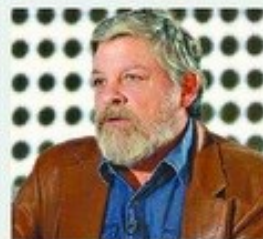
El espacio llegó a la señal privada el 2019.