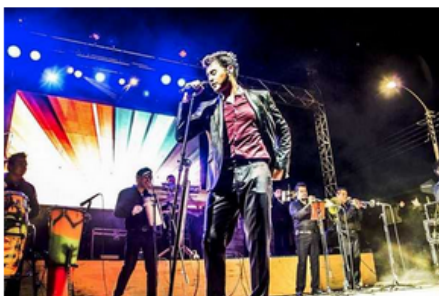
"Es un reconocimiento a la década de los noventa", dice Jordan.