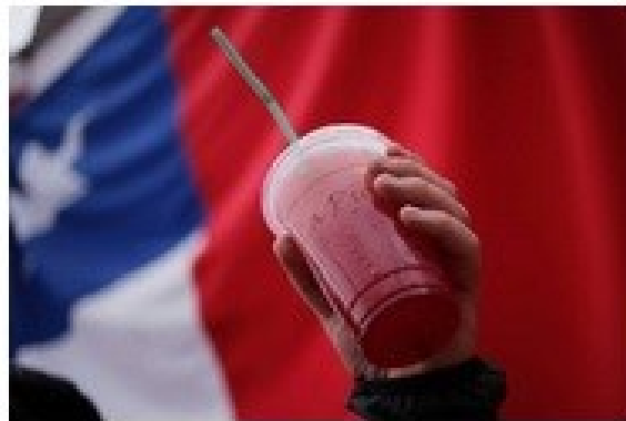
La campaña busca bajar el número de víctimas fatales en el 18.

El artista chileno de música bebible "Jordan" colabora en el spot que tiene como objetivo enviar un mensaje preventivo y de autocuidado a todas las personas en vísperas de de estas fechas festivas.